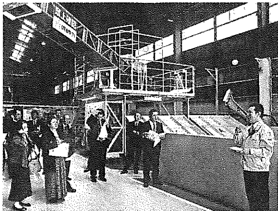
東洋観光グループの西日本リネンサプライが建設した「北広島エコファクトリー」(広島県北広島町、5月の見学会)

グループ企業で、清掃からの食品廃棄物のリサイクルリースなどの西日本リネンサプライ(広島県海田町)が広島県北広島町に建設し、今年三月に稼働した「北広島エコファクトリー」。調理時に出る野菜くずなどの食品廃棄物を発酵させ、有機肥料を製造する。 処理能力は一日五十トで、中国地方では最大規模。グループ外のコンビニ弁当の製造工場などから出る食品廃棄物を一日十ト受け入れている。グループの飲食店やホテル